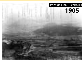
Pont de Claix - Echirolles 1905