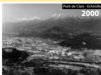
Pont de Claix - Echirolles 2000