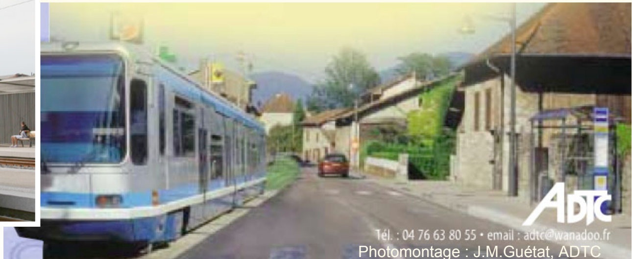
Tél. 04 76 63 80 55 • email : adtc@wanadoo.fr