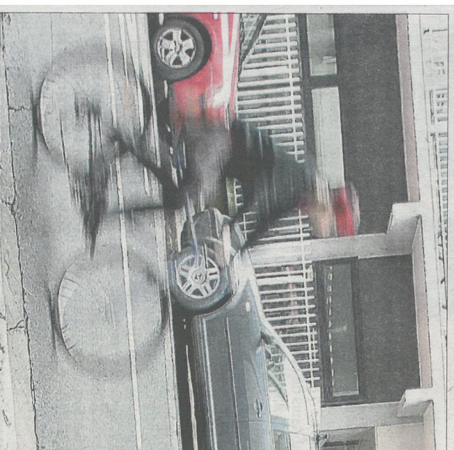
Peut-on améliorer la pratique du vélo en ville ? "Oui", disent les candidats grenoblois. Mais encore ?

De plus, cette année, nous avons fait le point par commune pour connaître les enjeux de chacune : nous aurons ainsi un schéma d'aménagement pour les modes doux qui définira les